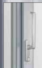
Klika s cylindrickou vložkou, provedení nerez