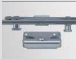
Bezpečná ventilace díky i.S Inteligentnímu bezpečnostnímu uzávěru