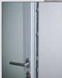
Háková bezpečnostní závora (ALU)

Ke vstupním plastovým a hliníkovým dveřím je nabízen široký výběr klik a madel, barevně ladících s celkovým designem dveří.