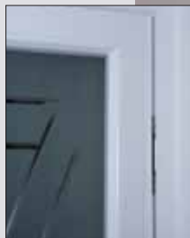
Skryté panty, luxusní řešení v souladu s designem dveří (ALU)