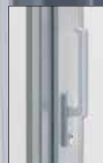
Uzamykatelná klika s cylindrickou vložkou