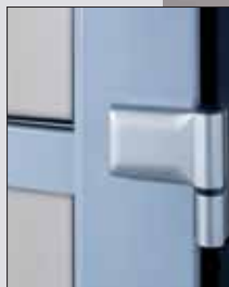
Standardní panty (PVC)