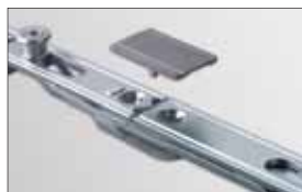
Plastové krytky kování