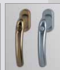
Klika se zámkem v klíce Klika s blokovacím tlačítkem