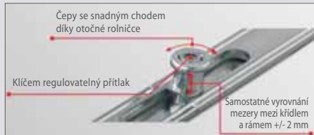
i.S Inteligentní bezpečnostní čep