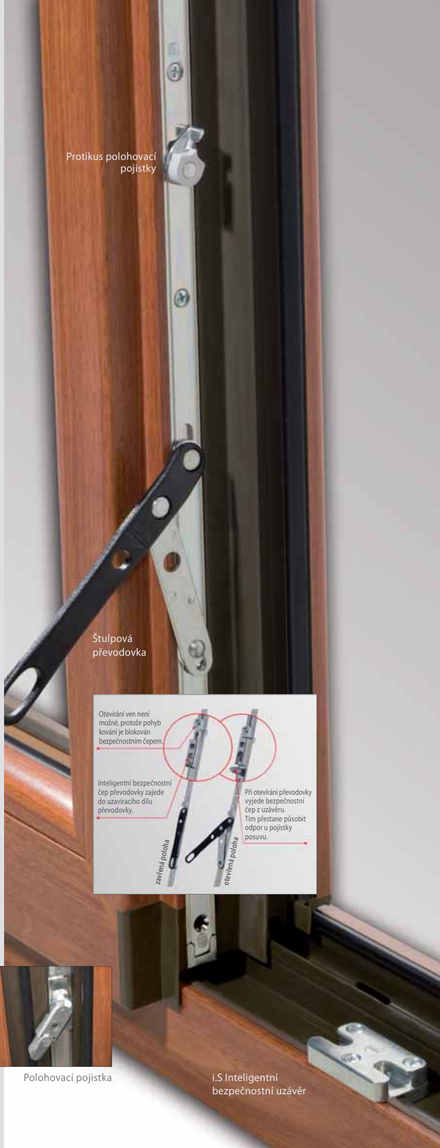
Protikus polohovací pojistky