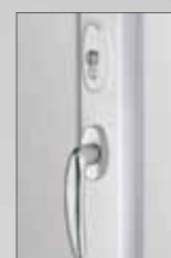
Uzamykatelné balkónové dveře