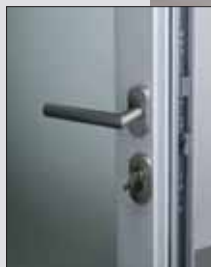
Kování - klika, panty (ALU)